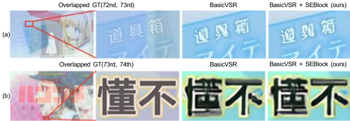
그림 2. 장면 전환이 발생했을 때 기존 모델과 제안 모델의 초해상화 결과 Fig. 2. Video Super-Resolution results of existing and proposed models when scene change occur

그림 3은 그림 2.a에 필터링을 적용하기 전과 후의 특징 맵 차이이다. 빨간색 점은 특징 맵이 낮은 가중치를 받았음을 의미한다. 그림 3에서 n번째 프레임의 특징 맵 차이가 diff_n 일 때, diff_{73} 이 diff_{72} 에 비해 크거나 작은 경우가 다른 프레